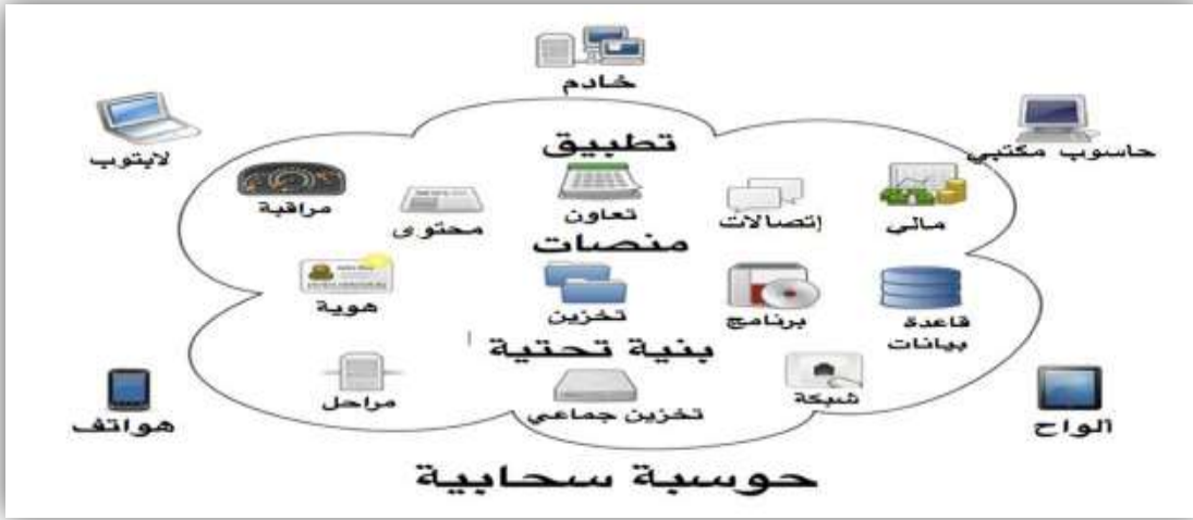
الشكل (3) يوضح متطلبات خدمة الحوسبة السحابية

المصدر: (سليمان، 2016، ص4) "دور التكنولوجيا في التعليم والتعلم وطرق استخدام الحوسبة السحابية في التعليم الحديث".