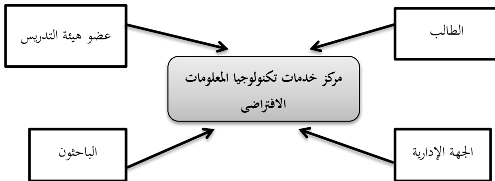
شكل (5): هيكلية الجامعة بالنسبة لمركز تكنولوجيا المعلومات

ثم تأتي مرحلة تقييم الجامعة من وجهة نظر استخدام تكنولوجيا المعلومات: هذه المرحلة تشتمل على تفهم البنية الأساسية لتكنولوجيا المعلومات في الجامعة الأسمرية الإسلامية، وتعرض الهيكلية الموجهة نحو الخدمة من قبل (الطالب، الإدارة، الباحث وعضو هيئة التدريس) كأساس لفهم الخدمات والعمليات والتطبيقات وأمنية البيانات التي تحتاجها للبقاء في الجامعة. كما هو موضح في الشكل التالي: